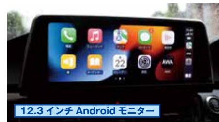
12.3インチ Android モニター

デザリング等でネット接続することで、YouTubeなどの動画をクルマの中でも楽しむことができる。