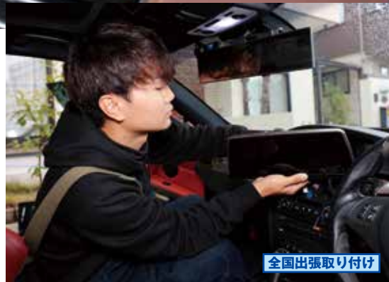
全国出張取り付け

問：エーダブルエー tel.080-8166-1991 埼玉県久喜市桜田 1-32-11 定休日：不定休 https://www.awa-coding.com